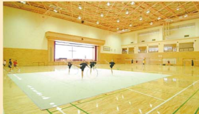
遺愛アリーナ内部

遺愛の体育館は天井の高さが13m、床面積が3,558㎡と、広く大きいのが特徴です。バスケットコートが2面とれるメインアリーナのほか、更衣室、放送室、トレーニング室をはじめ、会議室や面談室、部室など、快適に利用できる新しい施設が充実しています。