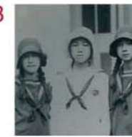
セーラー服アラカルト。

多くの女子中学生のあこがれの制服として知られる本校の制服は、今から半世紀以上も前の昭和5年(1930年)に制定されました。残念ながら戦争によって、途中何年か使用できなくなりましたが、復興が著しくなった昭和29年(1954年)には希望の復活を果たしました。復活当時は、教師側よりむしろ生徒側が積極的にかかり、現在のデザインに決定したといわれています。制定前は和服洋服随意とし、和服の場合は「元禄袖縮服」として質素な装いが原則でした。制服の制定は、生徒の父母からの「そろそろ制服を定めては」という意見がきっかけでした。