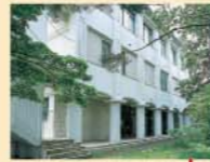
110周年記念ライト館