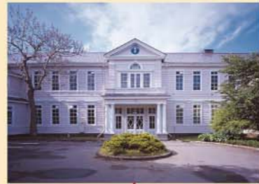
本館(現在修繕中です)