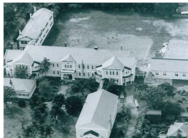
1957年(昭和32年)創立75周年当時