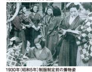
1930年(昭和5年)制服制定前の着飾り