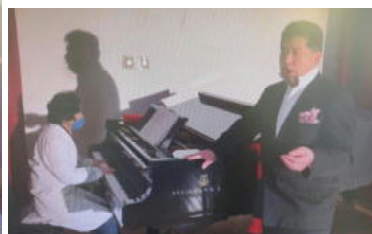
柳谷先生のバリトン